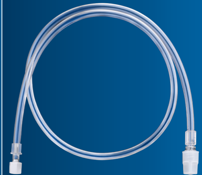
SL-327 / SL-328